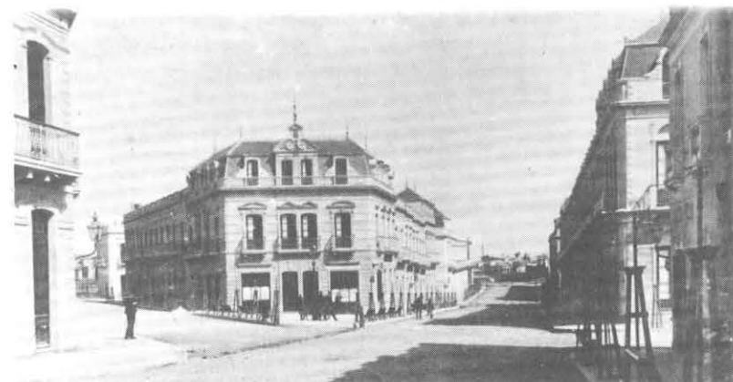
Barrio Reus al Norte, en el año 1890.