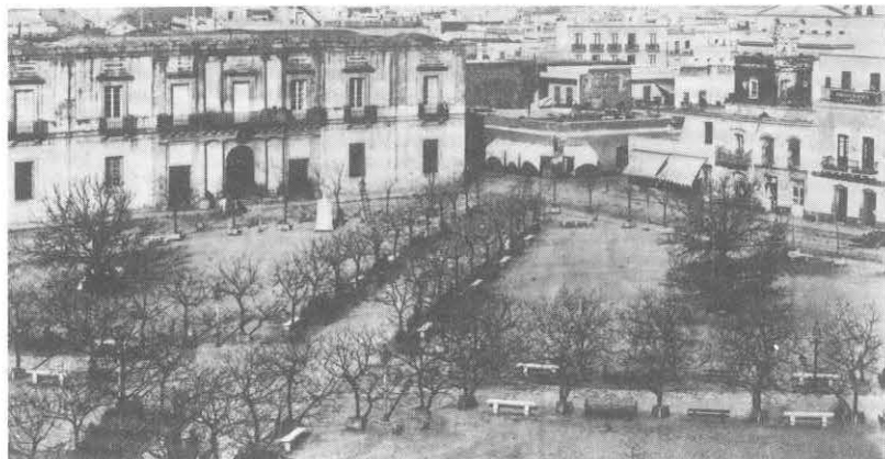
El Cabildo, construido en 1804, fotografiado en 1871.

la que funcionaba anteriormente en la actual Avenida Rondeau.