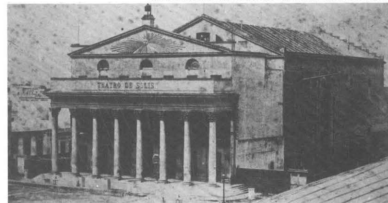
El Teatro Solís en 1870. No se habían construido aún sus alas laterales.