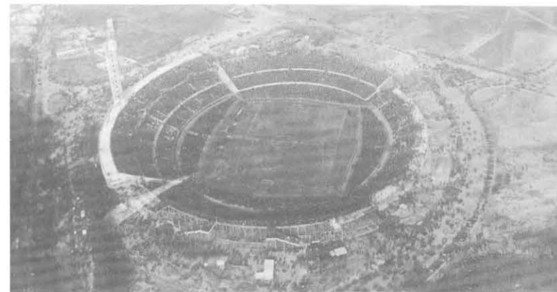
El Estadio Centenario en el día de su inauguración. Año 1930.