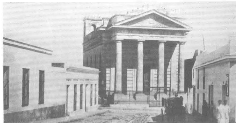
El Templo Inglés con su anterior emplazamiento. Año 1874.