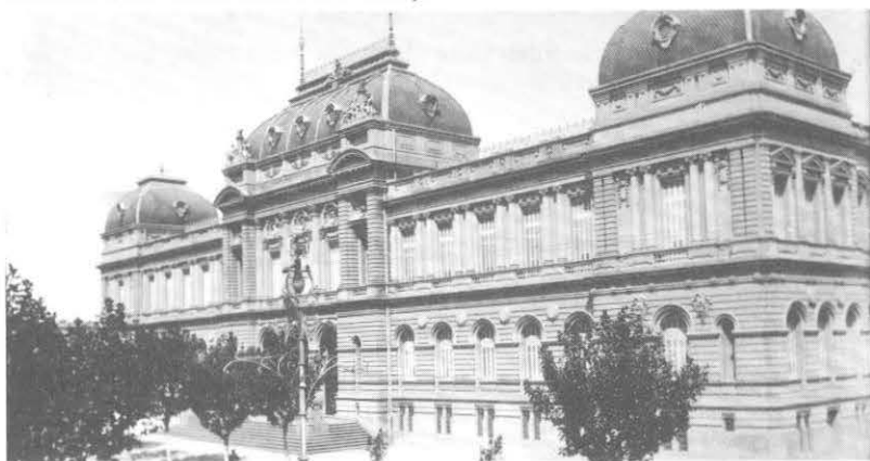
La sede de la Universidad de la República en el año 1912.