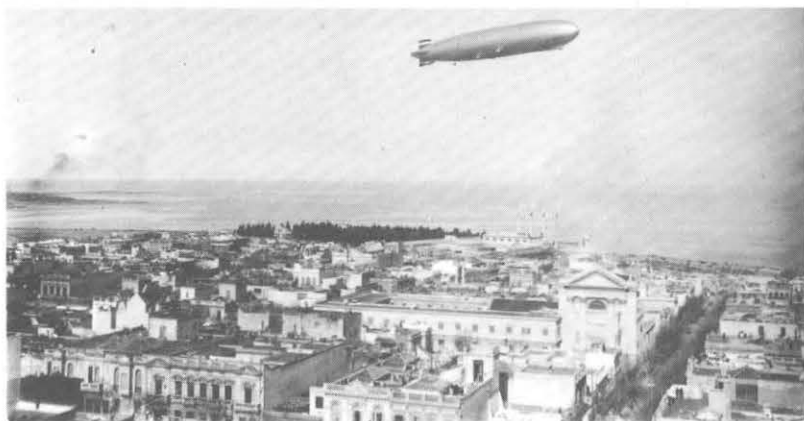
El dirigible alemán "Graff Zeppelin" sobrevolando la ciudad. Año 1934.