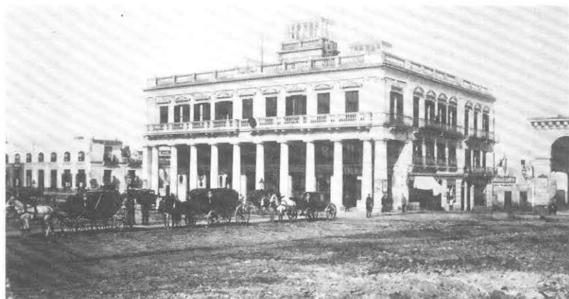
El Palacio Estévez en 1879, antes de instalarse en él la sede del Poder Ejecutivo.