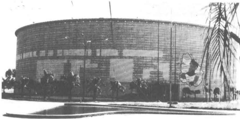
El Estadio Cerrado (Cilindro) en 1968.