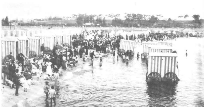
Carros baño en la Playa Ramírez. Año 1917.